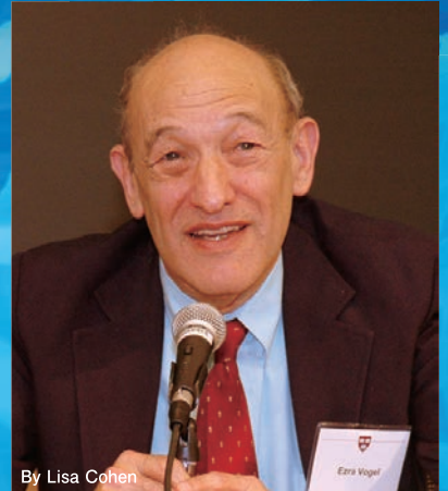
By Lisa Cohen