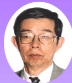
東京大学名誉教授 渡邊昭夫